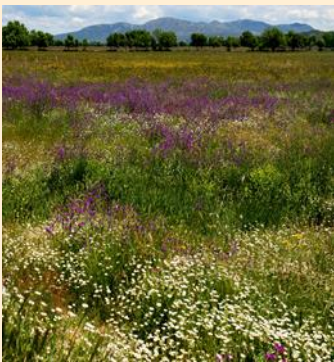
Bij Escorial, 45 km NW van Madrid

Die verrijkende eeuwig momenten, ze staan haaks op de onbeheersbare drang om ' alles uit het leven te halen '. Is dat mogelijk, alles uit het leven halen? Die wens is niet te vervullen. Want ze vooronderstelt dat de koffer van het leven oneindig groot is. Want anders komt er een moment dat de koek op is; de koffer is leeg, je hebt er alles uitgehaald, dat wilde je immers?! Dus: de wens alles uit het leven te halen leidt uiteindelijk tot een leeg bestaan. We kunnen niet leven als we alles uit het leven willen halen. Het leven van nu is dan nooit genoeg, want dat is immers nog niet alles?